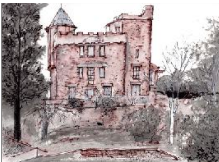
Dessin © Jean Paul Andrieu

Nous vous souhaitons à tous une très bonne année et espérons sincèrement que vous pourrez vous joindre à nous non seulement en octobre mais aussi lors d'autres événements au cours de l'année.