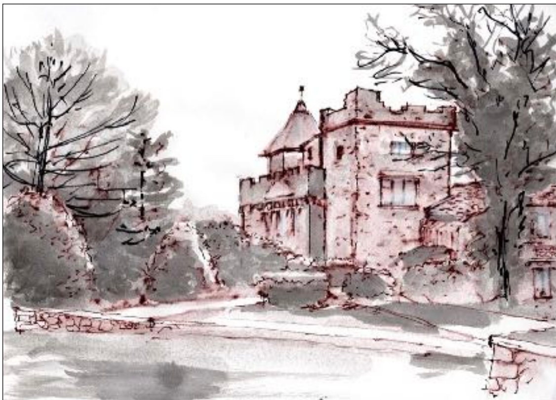
Le Collège des Ecosais par Jean Paul Andrieu